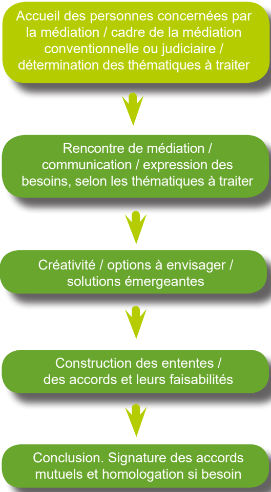
Illustration d'un processus en médiation familiale

Dans le processus, le médiateur familial contribue à des coopérations professionnelles si nécessaire. Ces professionnels qualifiés (avocats, notaires, experts comptables, conseillers professionnels, professionnels de santé, travailleurs sociaux...) peuvent être sollicités durant une séance de médiation ou en consultation externe.